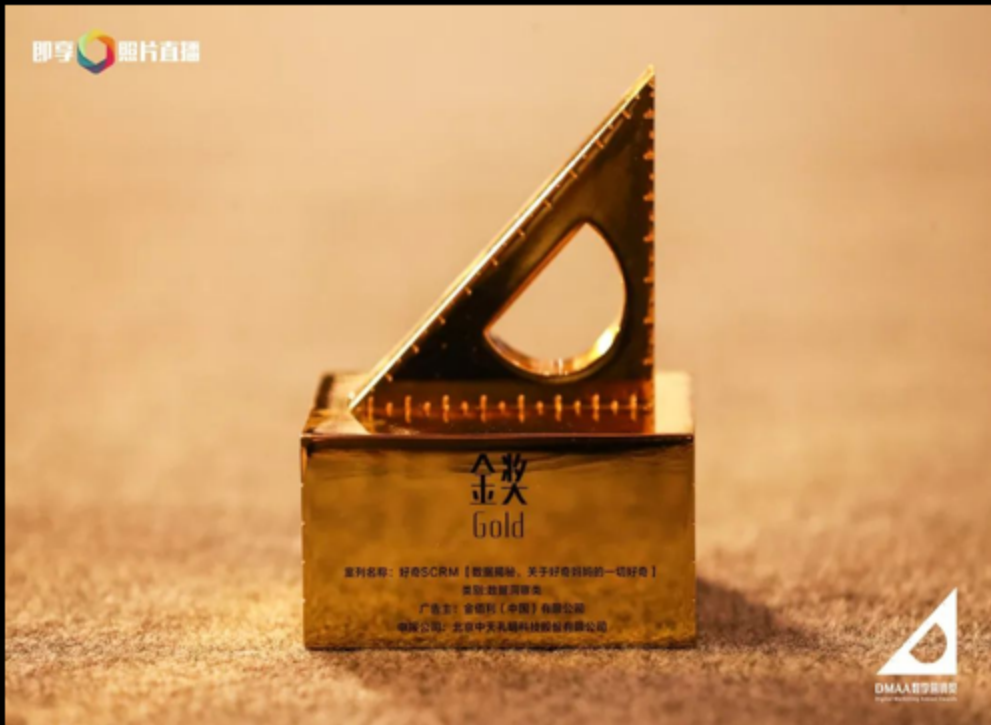
❖ DMAA金奖实物 ❖